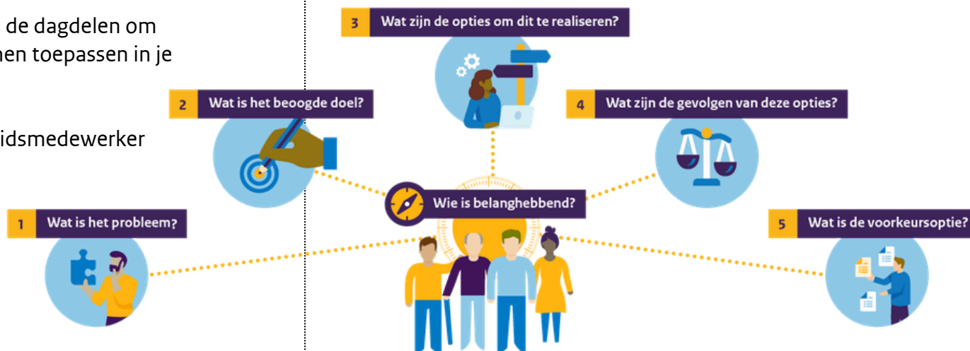
Visual: '5 vragen van het Beleidskompas'