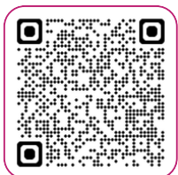
QR-code naar e-learning

Tip: Wil je over de doenvermogenstoets al meer weten? Doe dan alvast kosteloos deze e-learning!