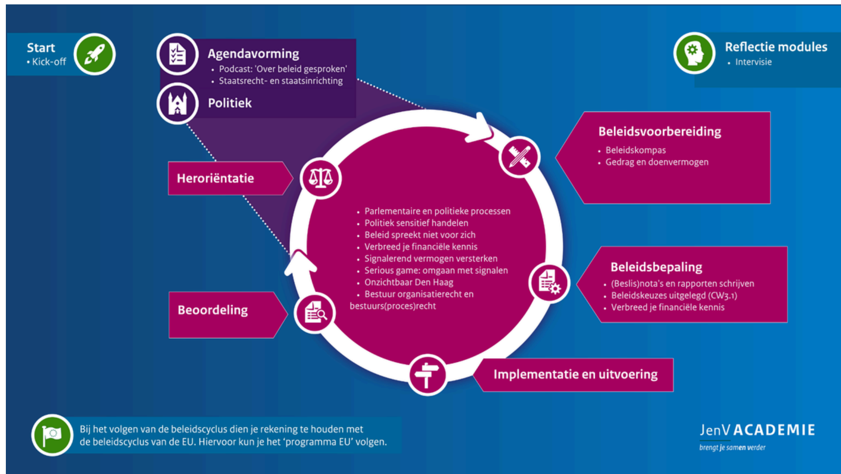
Visual: trainingen Opleiding Beleid in beleidscyclus

Binnen de opleiding wordt een onderscheid gemaakt tussen basis- en verdiepende trainingen. De basistrainingen zijn voor beginnende beleidsmedewerkers: hier leer je kennis en vaardigheden die onmisbaar zijn als professional! De verdiepende trainingen zijn voor de meer ervaren beleidsmedewerker. Idealiter volgt elke beginnend beleidsmedewerker alle trainingen.